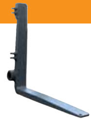
Gabelzinken für Zinkenverstellgeräte